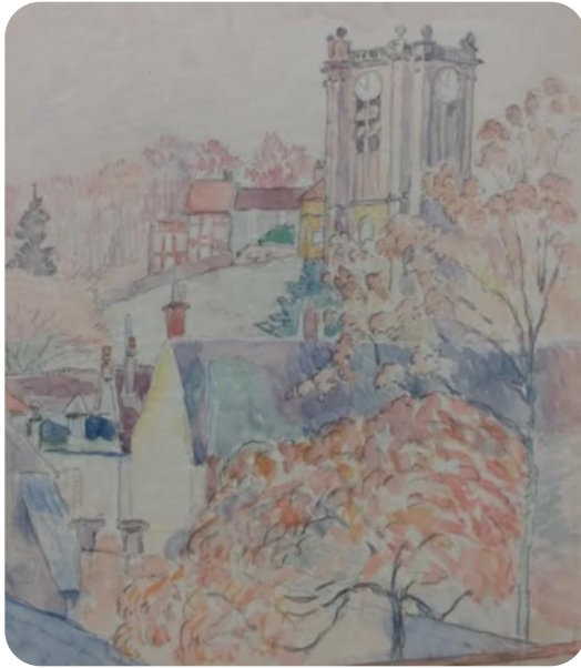
La Tour de l'église, Ashmolean Museum, Oxford